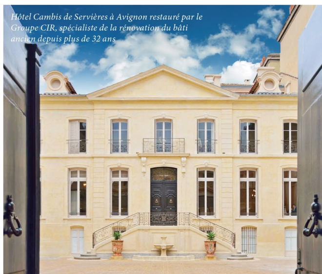
Hôtel Cambis de Servièrès à Avignon restauré par le Groupe CIR, spécialiste de la rénovation du bâti ancien depuis plus de 32 ans

VINEUIL-SAINT-FIRMIN et PARIS, sur rdv 6, rue Sédillot, 75007 PARIS Tél. : 06-08-69-14-86 Retrouvez quelques-uns des programmes immobiliers sélectionnés sur le site www.micelo.fr